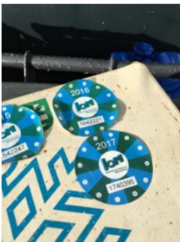
IMG_0523.jpeg [REDACTED] op 17 april 2018 09:48)

Is er een logboek aanwezig bij de koelinstallatie en bevat het logboek de verplichte informatie? artikel 6 F-gassenverordening