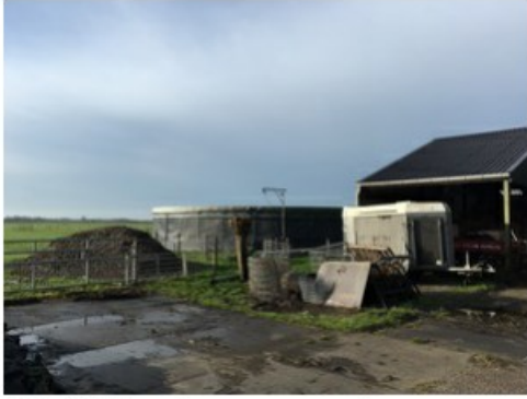
IMG_0502.jpeg [redacted] op 17 april 2018 09:41)

Is de kwaliteitsverklaring mestbassin binnen de inrichting aanwezig? (Let op overgangsrecht!)