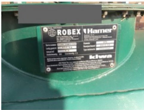
IMG_0508.jpeg [redacted] op 17 april 2018 09:18)

Document: Installatiecertificaat tank [redacted] f [redacted] op 17 april 2018 09:16)