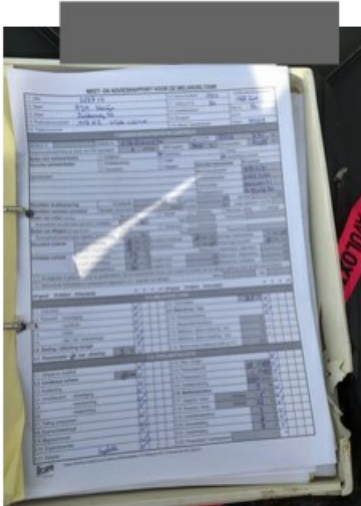
IMG_0512.jpeg [REDACTED] op 17 april 2018 09:49)