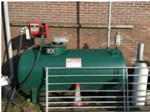
IMG_0505.jpeg [redacted] op 17 april 2018 09:18)

Is de bovengrondse tank met en leidingen en appendages geschikt voor het opslaan van gasolie?