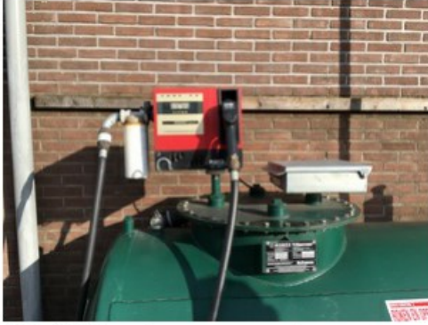
IMG_0509.jpeg [redacted] op 17 april 2018 09:25)