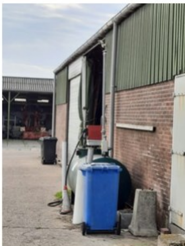
20211018_152440.jpg [REDACTED] op 19 oktober 2021 14:04)

Is het een inrichting in de zin van de Wet milieubeheer? Vul in Ja of NVT