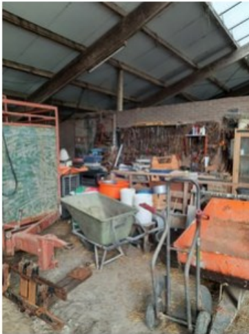
20211018_151144.jpg [REDACTED] op 19 oktober 2021 14:03)