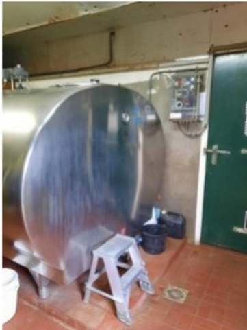
20211018_151635.jpg (op 19 oktober 2021 14:04)