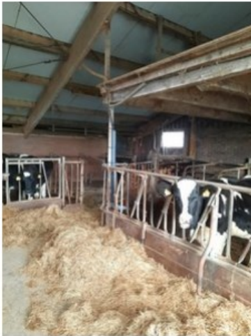
20211018_152122.jpg (op 19 oktober 2021 14:04)