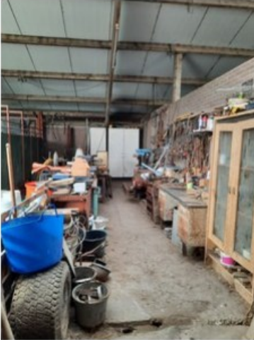
20211018_151154.jpg [REDACTED] op 19 oktober 2021 14:03)