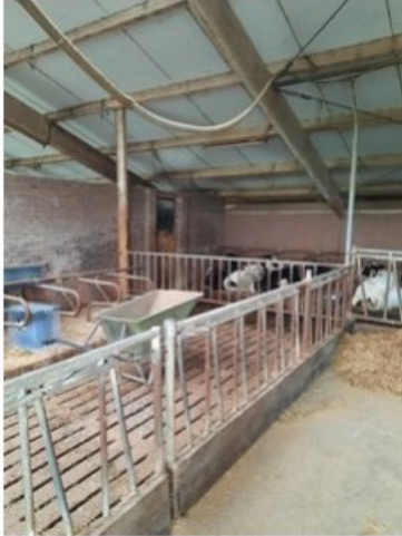
20211018_152120.jpg (op 19 oktober 2021 14:04)