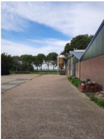
20211018_151258.jpg [REDACTED] (op 19 oktober 2021 14:03)