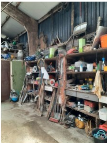
20211018_151140.jpg [REDACTED] op 19 oktober 2021 14:03)