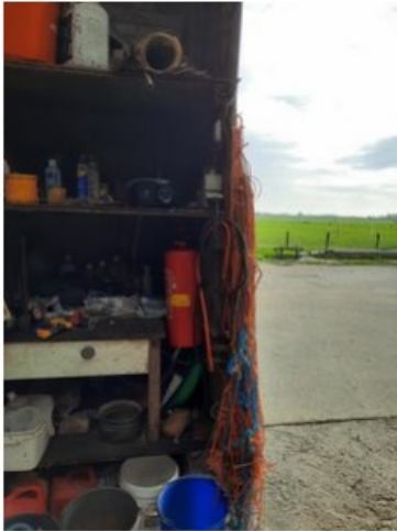
20211018_151118.jpg [REDACTED] op 19 oktober 2021 14:03)