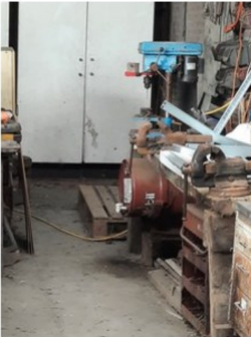
20211018_151159.jpg [REDACTED] op 19 oktober 2021 14:03)