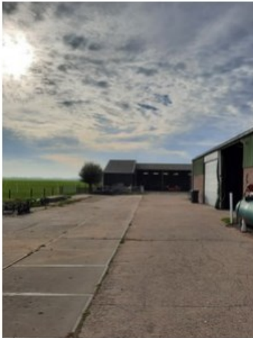
20211018_150920.jpg [REDACTED] (op 19 oktober 2021 14:03)