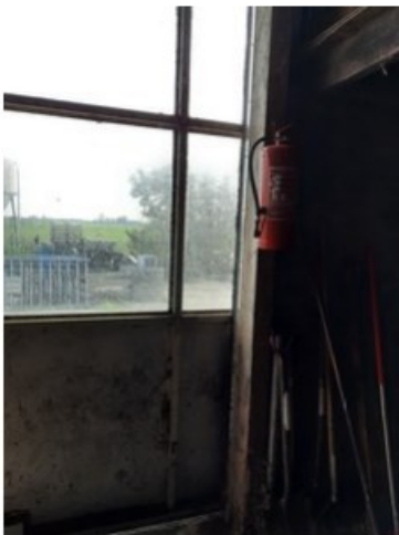
20211018_152428.jpg (op 19 oktober 2021 14:04)