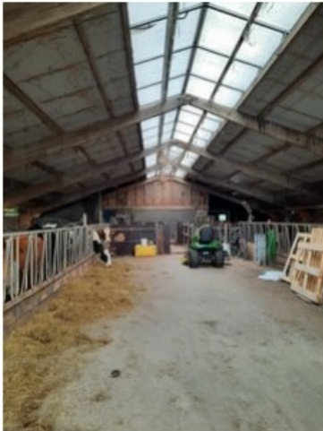
20211018_151411.jpg [REDACTED] op 19 oktober 2021 14:04)