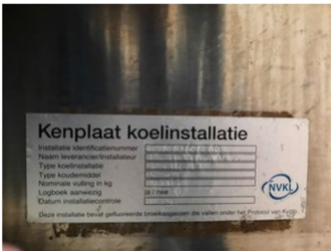
20211018_151843.jpg (op 19 oktober 2021 14:04)