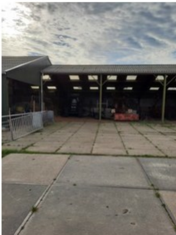
20211018_151306.jpg [REDACTED] (op 19 oktober 2021 14:04)