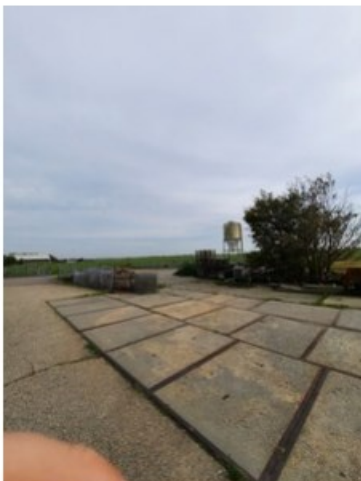
20211018_151103.jpg [REDACTED] (op 19 oktober 2021 14:03)