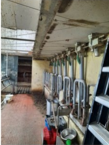
20211018_151526.jpg (op 19 oktober 2021 14:04)