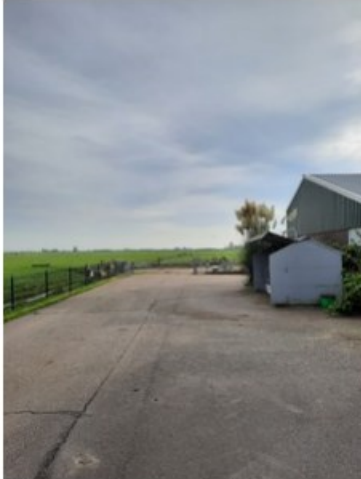
20211018_150752.jpg [REDACTED] (op 19 oktober 2021 14:03)