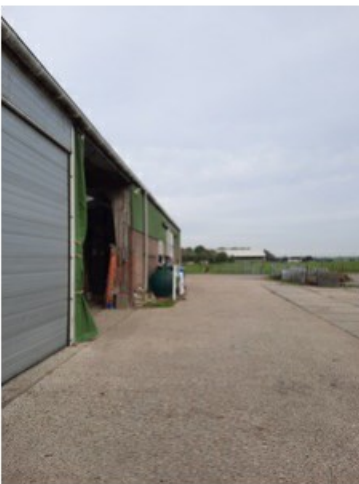
20211018_151250.jpg [REDACTED] op 19 oktober 2021 14:03)