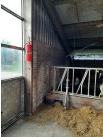
20211018_151355.jpg [REDACTED] op 19 oktober 2021 14:04)