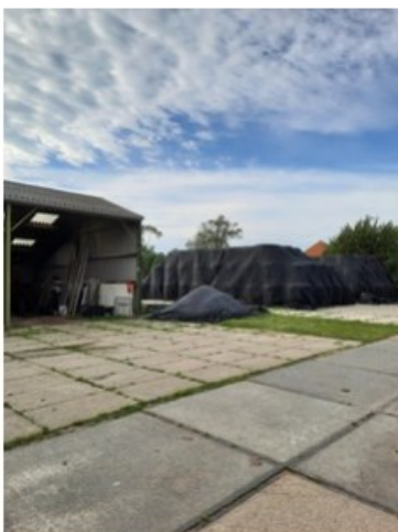
20211018_151313.jpg [REDACTED] (op 19 oktober 2021 14:04)