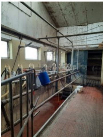
20211018_151524.jpg [REDACTED] op 19 oktober 2021 14:04)