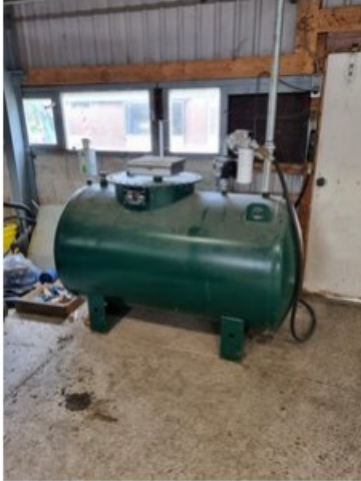
20220513_105529.jpg [REDACTED] (op 24 mei 2022 16:34)