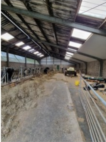
20220513_111313.jpg [REDACTED] op 24 mei 2022 16:35)