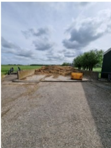
20220513_111528.jpg [REDACTED] op 24 mei 2022 16:35)