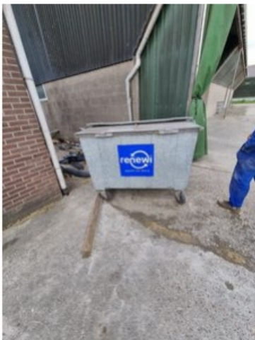
20220513_110835.jpg [REDACTED] (op 24 mei 2022 16:35)