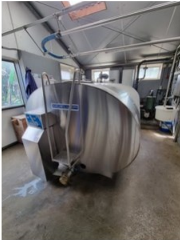
20220513_110605.jpg [REDACTED] (op 24 mei 2022 16:34)