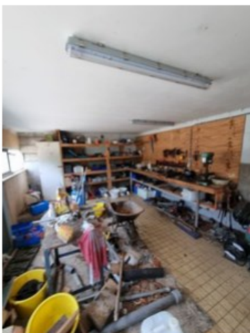
20220513_105924.jpg [REDACTED] op 24 mei 2022 16:36)

Wat voor soort opslag van gevaarlijke stoffen in emballage betreft het? (vink alle soorten opslagen die bij dit bedrijf aanwezig zijn aan!)