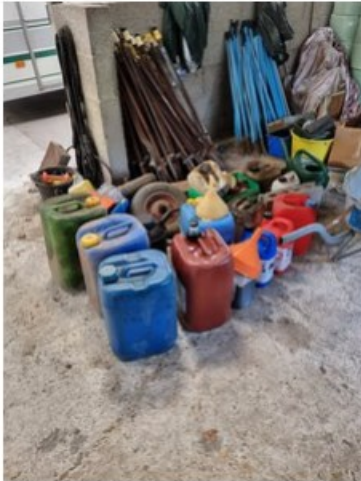
20220513_105620.jpg [REDACTED] op 24 mei 2022 16:36)