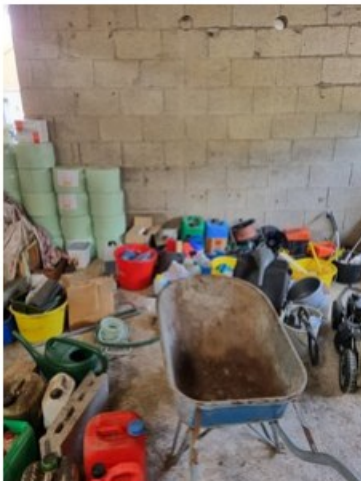
20220513_105735.jpg [REDACTED] op 24 mei 2022 16:36)