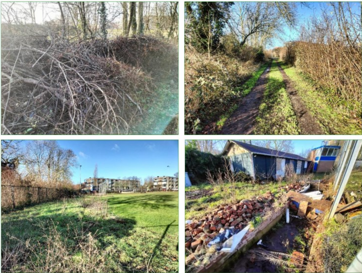
Aan de westzijde van het plangebied, buiten het hek van het sportveld, liggen bosschages en takkenhopen langs de toegangsweg (boven). Rommelhoekjes en verruigde delen (onder), aan dezelfde westzijde van het plangebied, liggen nét binnen hetzelfde hek. Grenzend aan landelijk gebied bieden deze elementen tezamen geschikt biotoop voor kleine marterachtigen

Het plangebied biedt schuilmogelijkheden in de vorm van dichte vegetatie, opgeslagen materialen en takkenbossen waar kleine marterachtigen (Bunzing, Hermelijn en Wezel) gebruik van kunnen maken.