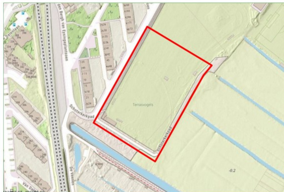
Figuur 1. De ligging van het plangebied (rood omlind).

Ten westen, op ongeveer 1 kilometer afstand van het plangebied, ligt Natura 2000-gebied Kennemerland-Zuid.