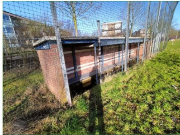
De lage sportgebouwen langs de westzijde van het plangebied, met van links naar rechts: De houten schuur, het stenen uitkijktorentje en de lage dug-out.