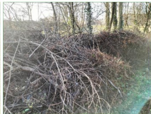
De toegangsweg wordt geflankeerd door struiken en bomen en er liggen hier en daar (grotere) takkenhopen.