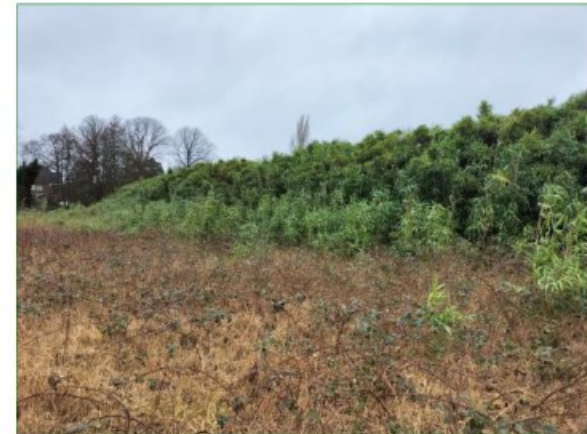
Bosje langs de zuidwestzijde langs het plangebied (links) en bamboehaag in de noordwesthoek (rechts).