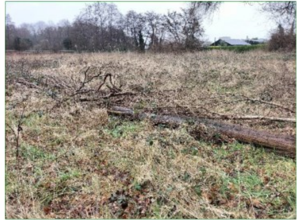
In het zuidoosten van het plangebied staan en liggen enkele bomen wat verder in het verruigde terrein.