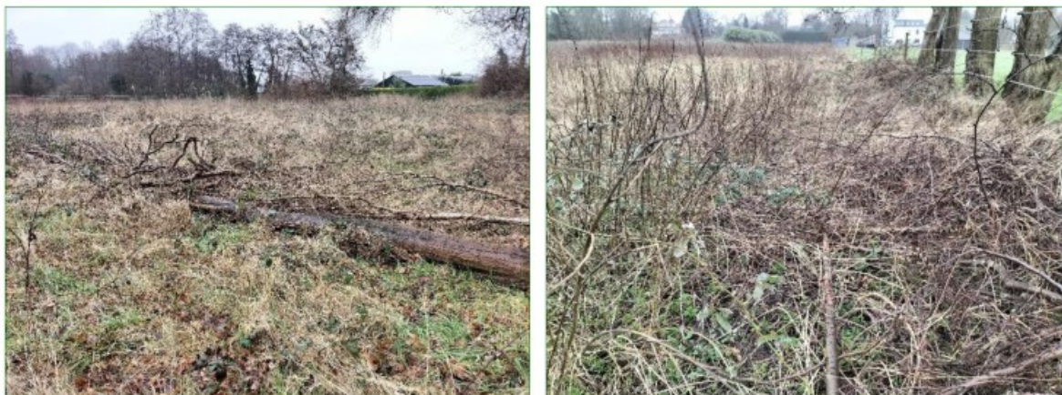
Het met bramen verruigde terrein, geflankeerd door bomenrijen en struikjes, biedt potentieel geschikt leefgebied voor kleine marterachtigen (Bunzing, Hermelijn en Wezel).

Het plangebied biedt schuilmogelijkheden in de vorm van dichte vegetatie, opgeslagen materialen en takkenbossen waar kleine marterachtigen (Bunzing, Hermelijn en Wezel) gebruik van kunnen maken.