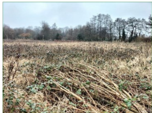
Het grootste deel van het plangebied bestaat uit een met struwelen verruigd open veld.